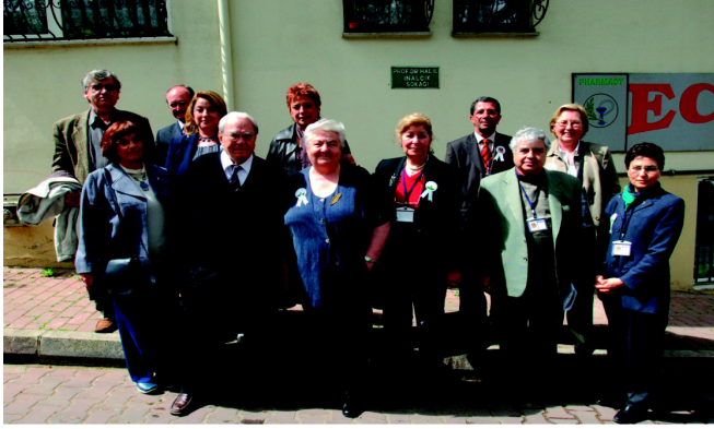
Prof. Dr. Halil İnalıcık Sokađı'nın açılışı, Halil Hoca, kızı ve meslektaşları ile 06.04.2006