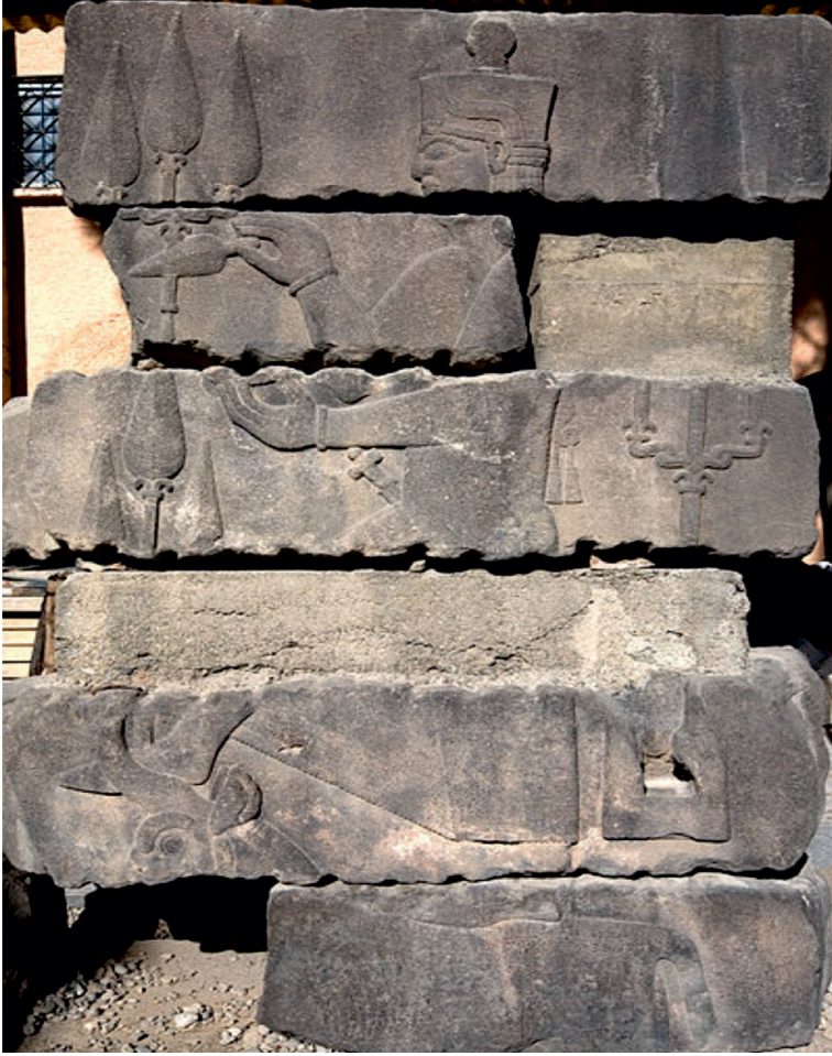
Şekil 2: Bir Urartu Kalesi'nin kalıntıları arasında taş üzerine işlenmiş Urartu Tanrısı Teişeba'nın Kabartması (Van Müzesi)