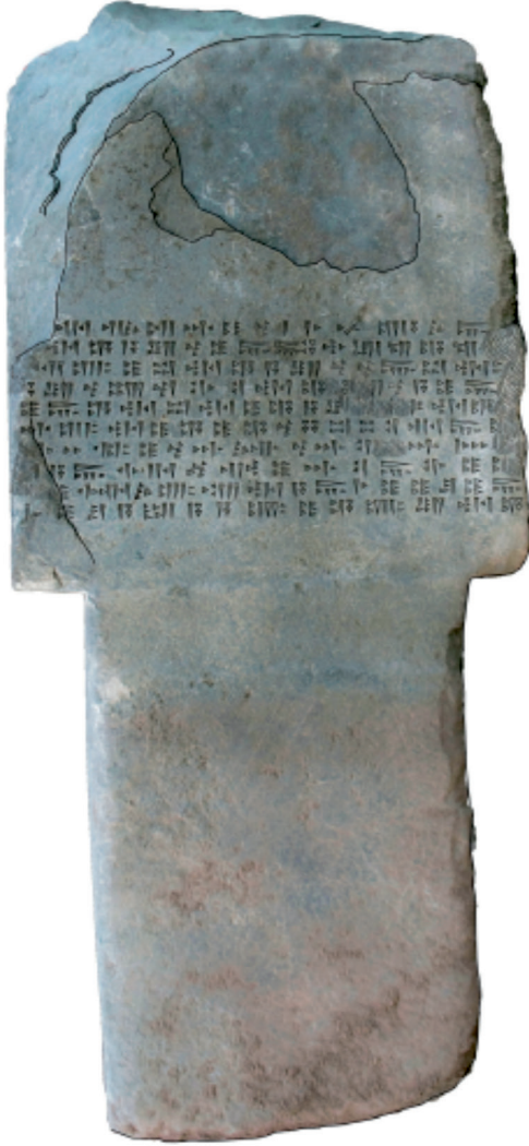
Şekil 3: Kavuştuk Yazıtı 1