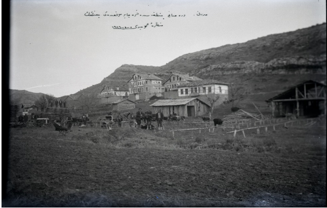
Mudurnu Deresağ mıntkasında Karaçayır mevkiindeki çiftlik-1926

Bengüboz koleksiyonu, Cumhuriyetin ilk yıllarında sosyal hayata dair çok çeşitli bilgiler vermektedir. Dönemin sağlık problemleri ve savaş sonrası kol ve bacağı kaybeden gazilerin durumuna dair bilgileri yansıtan fotoğraflar da mevcuttur. Bu fotoğraflar yerel tarih arařtırmaları için olduđu kadar tıp tarihi açısından da önem taşımaktadır.