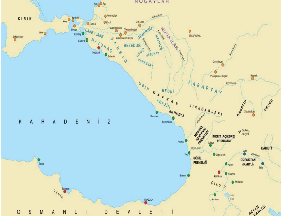
Ek 1: Kafkasya'nın Karadeniz sahilinde, Soğucak Kalesi'nin de yer aldığı başlıca kaleler ve Çerkes kabilelerinin yaşadıkları bölgeleri gösteren harita (XVIII. Yüzyılın son çeyreği) (Cengiz Fedakar, Kafkasya'da İmparatorluklar Savaşı , İş Bankası Kültür Yayınları, İstanbul 2014, Harita 2).