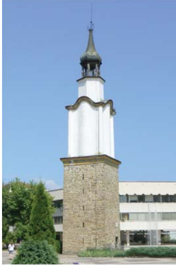
Orhaniye'deki Saat Kulesinin Bugünkü Görünümü https://commons.wikimedia.org/wiki/Category:Botevgrad_clock_tower?uselang=tr