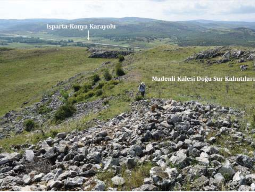
Resim 9: Madenli Kalesi Sur Kalıntıları