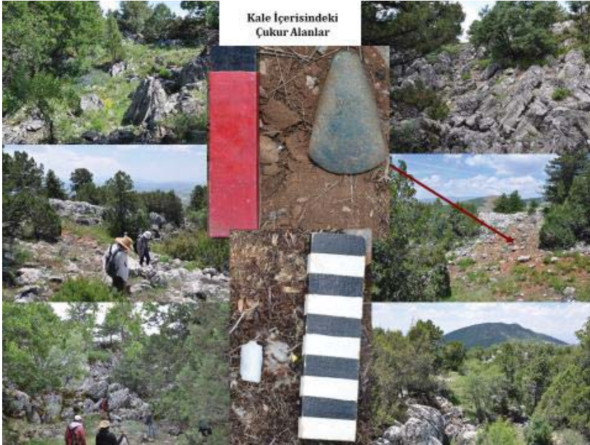
Resim 15: Kızılçarşaf Kalesinde Bulunan Obruklar ve Ele Geçirilen Taş Balta