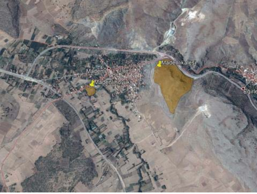
Resim 8: Madenli Kalesi (Pisidia Survey Arşivi)