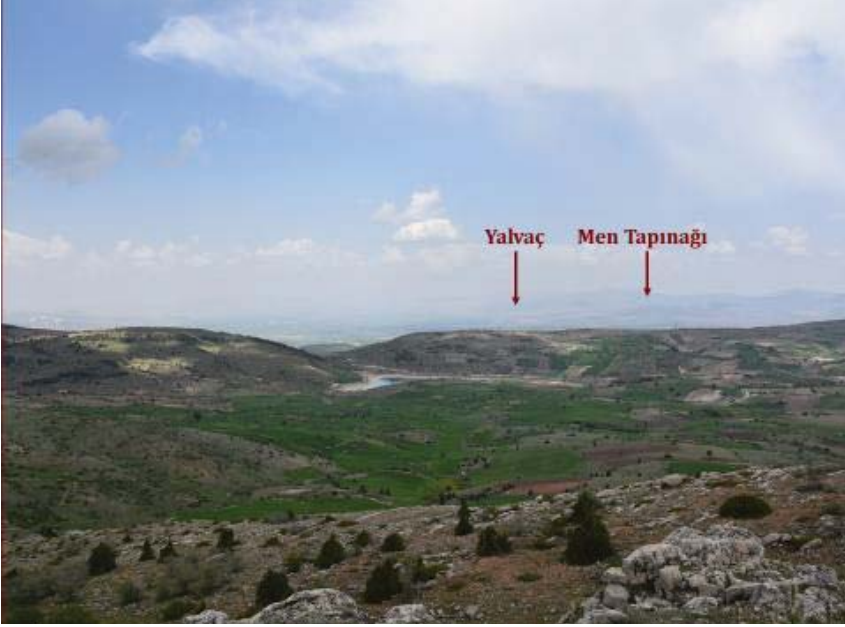
Resim 10: Yaylacıkkaleden Men Tapınağı ve Yalvaç