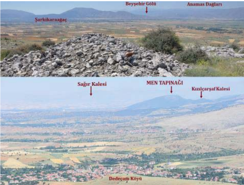
Resim 13: Büyükören Kalesinden Men Tapınağı ve Diğer Kaleler (Pisidia Survey Arşivi)