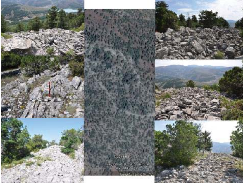
Resim 14: Kızılçarşaf Kalesi ve Surları