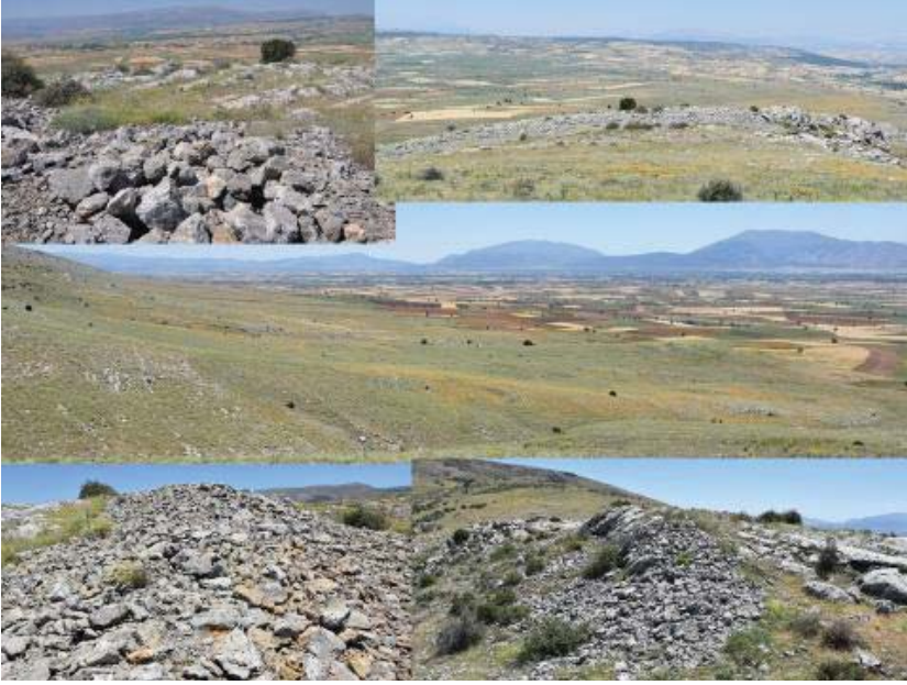
Resim 12: Büyükören Kalesi ve Yerleşimi