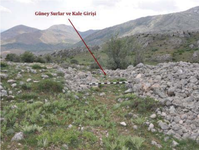
Resim 11: Yaylacıkkale Giriş Kapısı