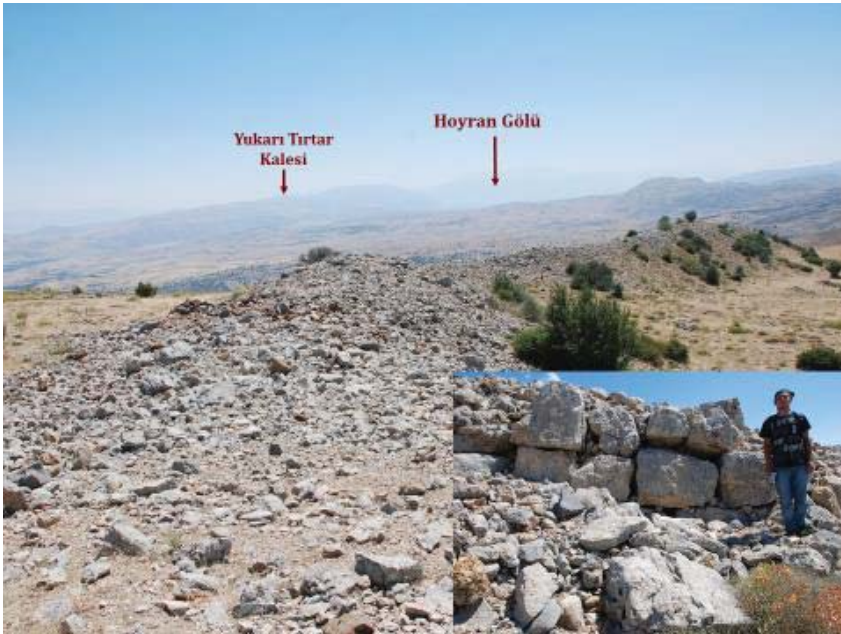
Resim 5: Sağır Kalesi Surları ve Duvar Örgüsü