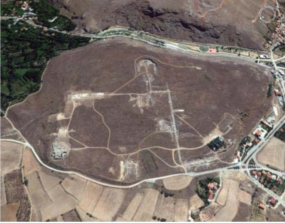
Resim 1: Pisidia Antiocheia Kenti Genel Grnm