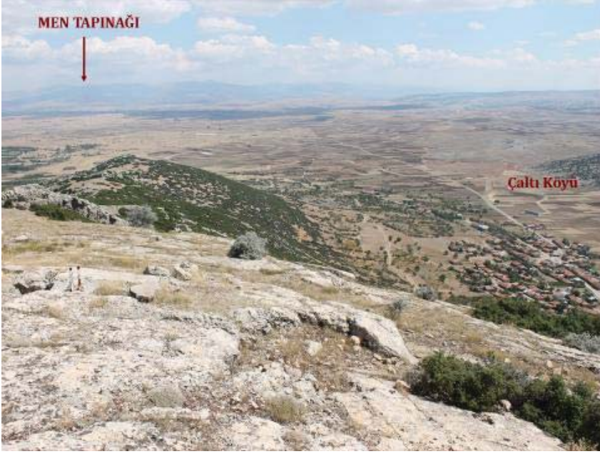
Resim 6: Çaltı Kalesinden Men Tapınağı