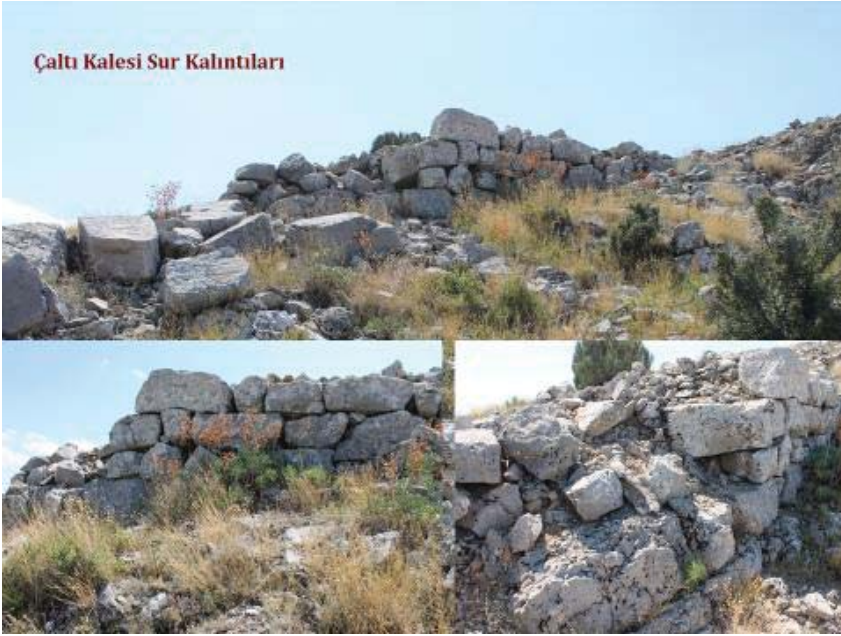
Resim 7: Çaltı Kalesi Sur Duvarları