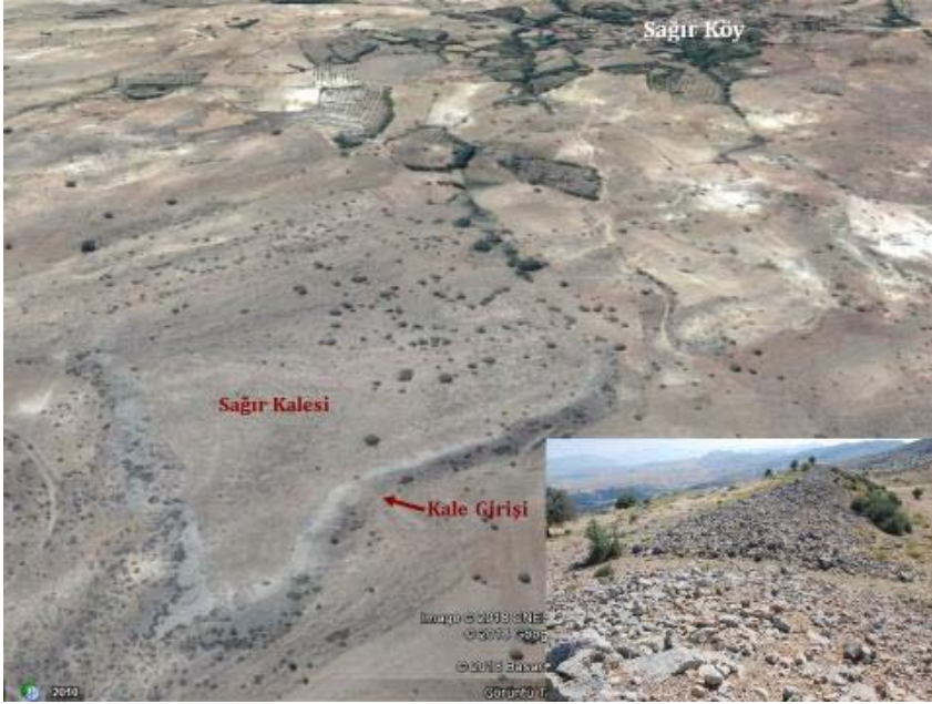
Resim 4: Sağır Kalesi ve Girişi