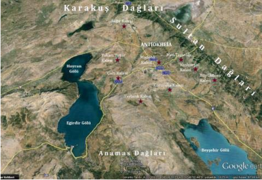
Resim 3: Antiokheia ve Etrafında Bulunan Kale Yerleşimleri