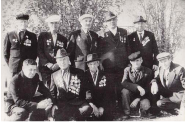
(Azak bölgesi gazileri)

Devninskoye köyünden 230 kişi, II. Dünya Savaşı’nda cephelerde düşmana karşı çarpışmıştır. Bunların 32’si, Sovyet Sosyalist Cumhuriyetler Birliđi’nin nişan ve madalyalarıyla ödüllendirilmiştir. Köy halkından olup savaşta hayatını kaybeden 120 askerin anısına anıt dikilmiştir. Devninskoye köyünde, köyün kurtuluşu için yapılan çarpışmalar sırasında hayatını kaybeden 43 Sovyet askerinin toplu mezarlıđı da bulunmaktadır. Köyde ayrıca, Ukrayna’da 1932-1933 yıllarında gerçekleşen büyük açlık felaketi anısına bir anıt da dikilmiştir.