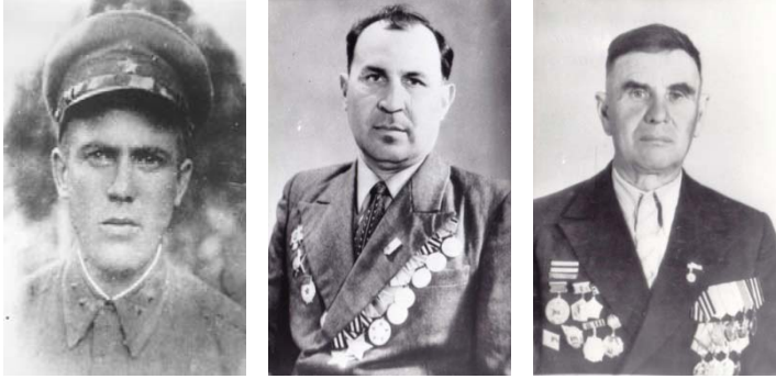
Gagauz gazileri ve şehitleri.

Akimov ilçesi, Vladimir köy konseyine bağlı Aleksandrovka Köyü , Malıy Utlük nehrinin sağ kıyısında, Akimovka kasabasına 3,5 kilometre mesafededir. Nehrin karşı kıyısında, Vladimirovka köyü bulunmaktadır. 1862 yılında kurulan Aleksandrovka köyünün nüfusu, 2001 yılının nüfus sayımına göre, 379 kişidir. Köy, Sovyetler Birliği Kahramanı Buyuklı Anton Yefimoviç (1915-1945) ile ünlüdür.