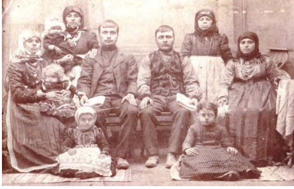
(Göçmen ailesi XXIII yy.)

Besarabyalı Bulgarların ve Gagauzların yeni topraklardaki iskânı büyük zorluklarla gerçekleşmiş, 1862-1865 yıllarında yaşanan kuraklık dönemi onlar için zor geçmişti. Göçmenler, 1866 yılında kendi topraklarını ekmeyle bile reddedip Kuban'a yerleşme girişiminde bulunmuşlardı. Fakat hükümet, onların Kuban'a yerleşmelerine kesin bir şekilde karşı çıkmış ve göçmenleri yerlerinde tutabilmek için, kiliselerin inşası için 51 bin ruble tahsis etmişti. Göçmenlerin yaklaşık beş yıl boyunca (1866-1870) Bulgar yerleşim yerlerindeki fazla topraklardan elde ettikleri bütün gelirlerin, onların tasarrufunda kalmasına izin vermişti. Bu önlemler, nihayet, beklenen sonucu verdi.