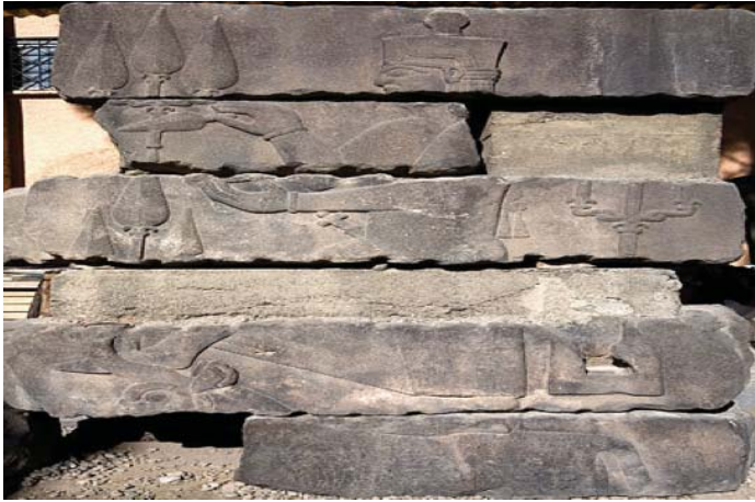
Şekil 3: Bir Urartu Kalesinin kalıntıları arasında taş üzerine işlenmiş Urartu Tanrısı Teişeba'nın kabartması (Van Müzesi)