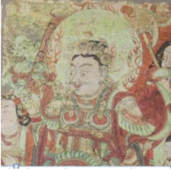
Resim 17: Kayıp Bezeklik duvar resminden lokapala detayı, Berlin Museum für Indische Kunst, IB 6879, (Le Coq, 1913)