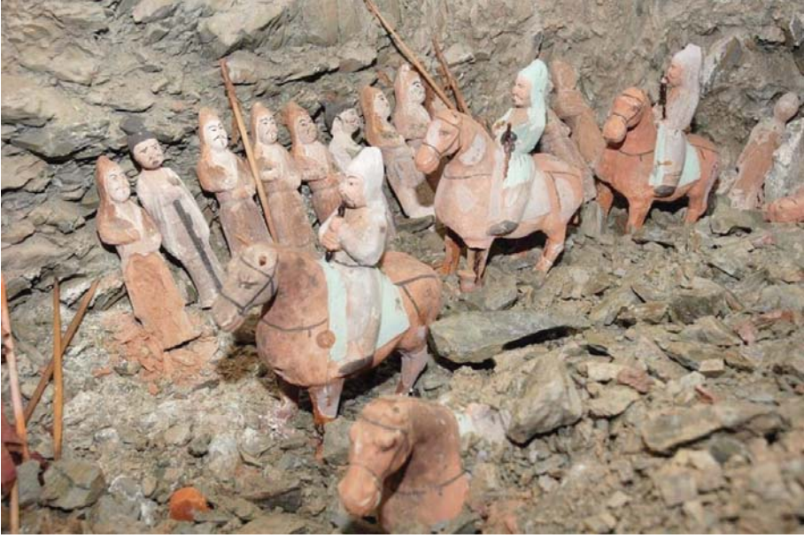
Resim 4: Yoğ törenini canlandıran toprak heykelcikler, Mayhan Uul Kurganı, 7. Yüzyıl, Moğolistan ( https://www.ergenekun.net/gokturk-mayhan-uul-kurgani.html )