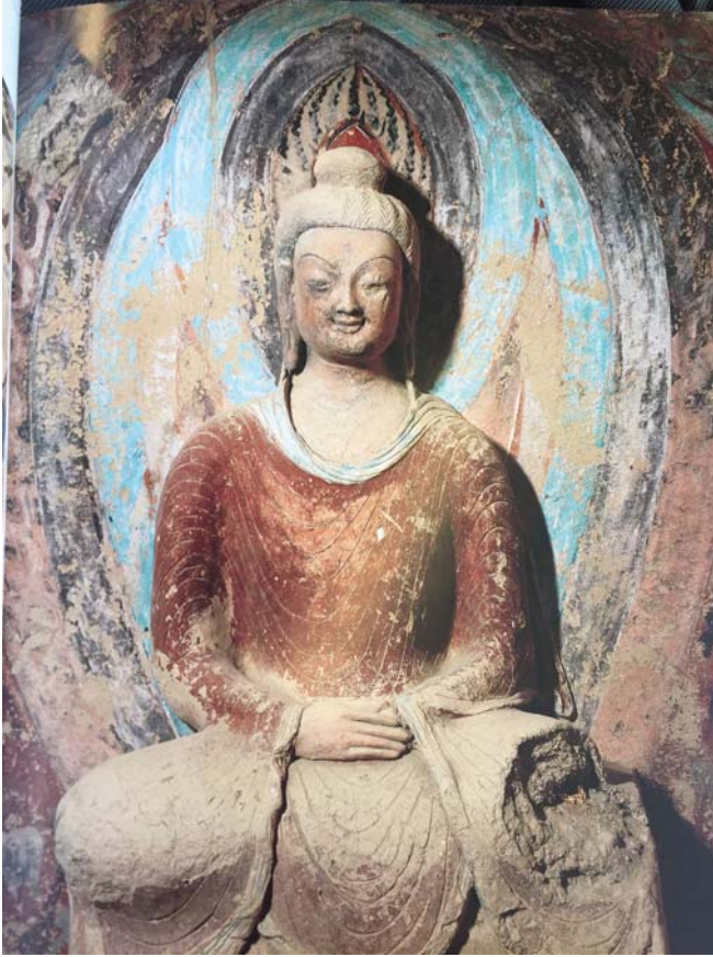
Resim 10: 259 no.'lu Mogao Mağarasında Buda Heykeli , V. yüzyıl, Kuzey Wei Dönemi