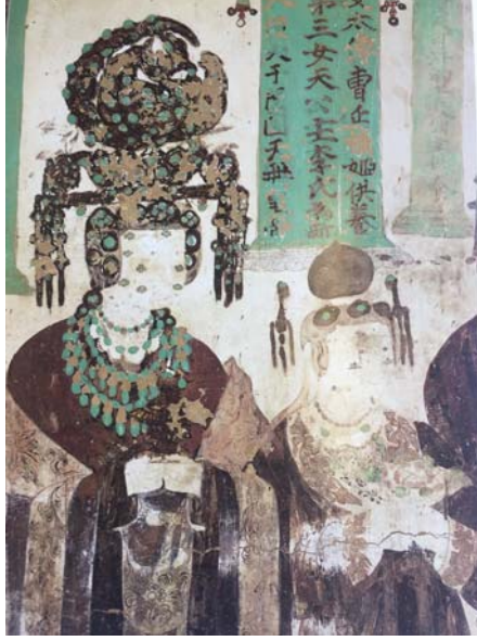
Resim 15: 61 no.'lu Mogao Mağarası, kadın vakıfçılar, 10. yüzyıl.