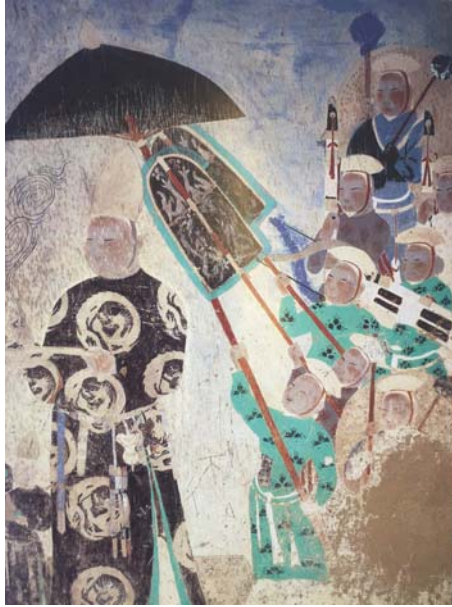
Resim 16: 409 no.'lu Mogao Mağarası, Uygur vakıfçı, 11. Yüzyıl