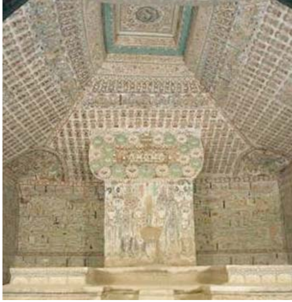
Resim 2: Mogao 61 numaralı mağara, 10. Yüzyıl