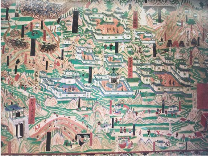
Resim 8: 61 No'lu Mağaranın batı duvarındaki Wutai Dağı tasvirinden detay (Whitfield, vd. 2000)