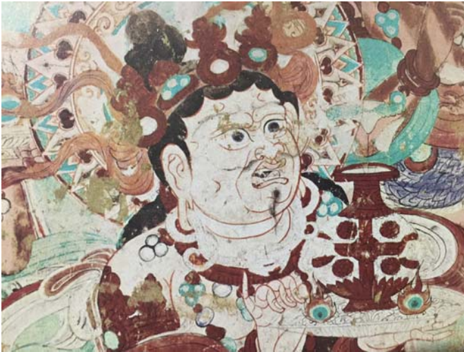
Resim 18: 36 no.'lu Mogao Mağarası duvar resminden ejder hükümdar (Nagaraja) detayı (5000 Ans d'Art Chinois, Peinture 14)