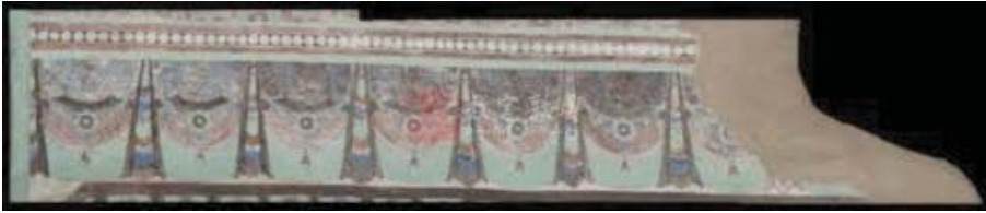
Resim 7: 61 No'lu Mağaranın kuzey duvarının üst kısmındaki perde motifli bezeme