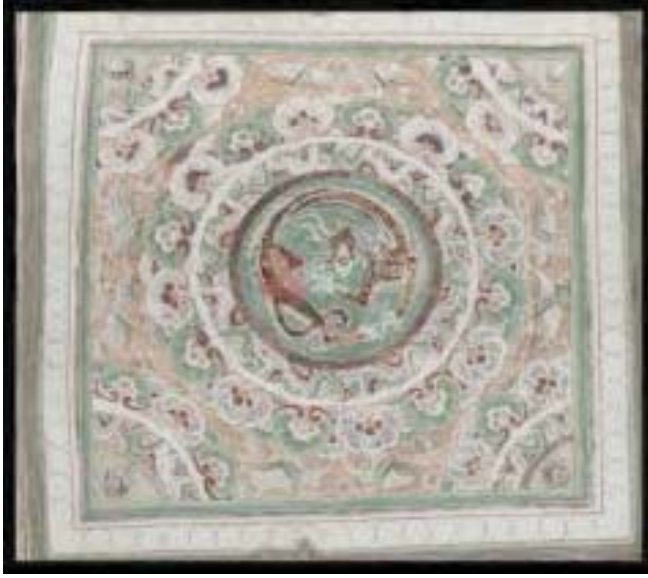
Resim 6: 61 No'lu Mağaranın tavan ortasındaki bezeme