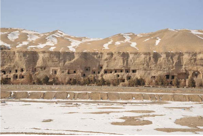
Resim 1: Mogao Mağaraları Dış Görünüşü