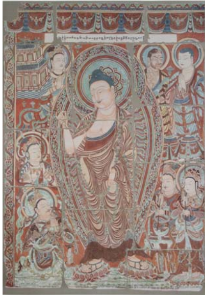
Resim 14: Pranidhi Sahneli Kayıp Duvar Resmi, Bezeklik 20 No'lu Mağara, 325 cm x 460 cm (LeCoq 1913)