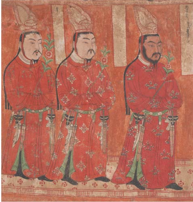
Resim 12: Vakıfçı Uygur tiginleri, M.S. X-XII. yüzyıl, Bezeklik Mağarası No: 20.