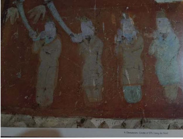
Resim 11: 275 no.'lu Mağarada ellerinde nefirlerle resmedilmiş Budist Türk vakıfçı atalar, (5000 ans d'art chinois)