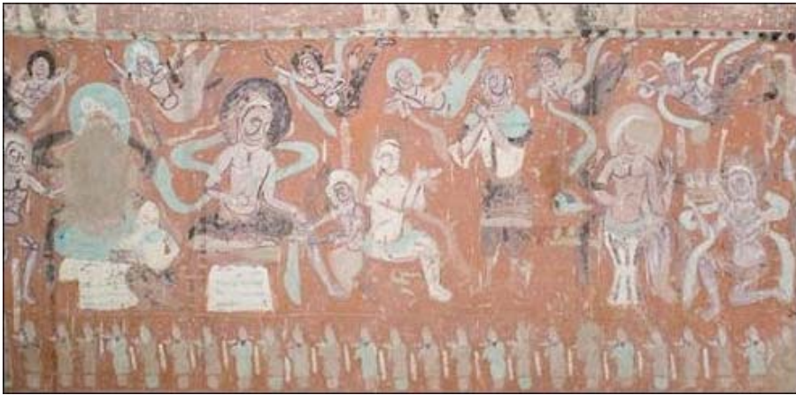
Resim 5: 275 no'lu Mogao Mağarası Duvar Resminde Jataka tasviri , V. Yüzyıl, Kuzey Liang Dönemi (5000 Ans d'Art Chinois, Peinture 14)