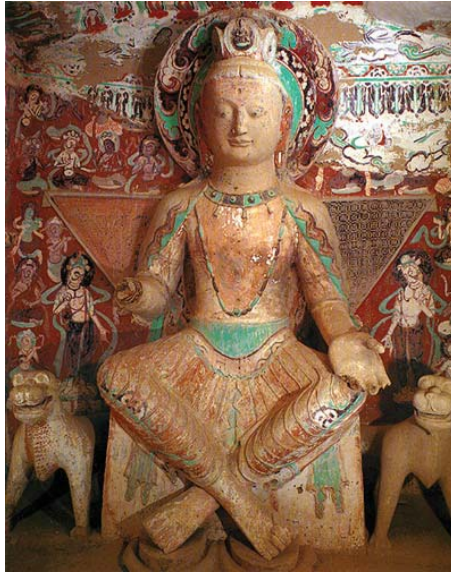
Resim 9: 275 no'lu Mogao Mağarasında Dev Maitreya Heykeli , V. yüzyıl, Kuzey Liang Dönemi