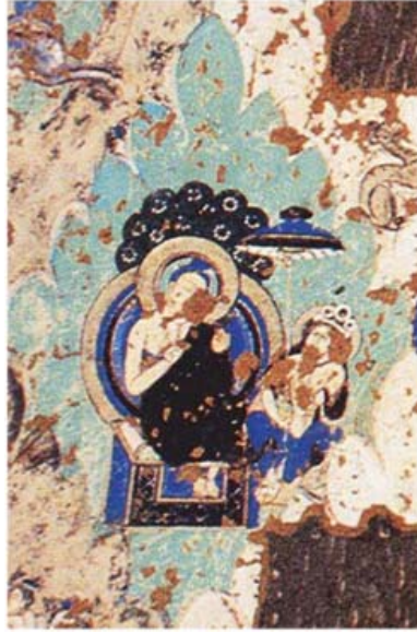
Resim 13: Pranidhi Sahneli Duvar Resmi, Kızıl 38 No.'lu Mağara (Konczak 2012)