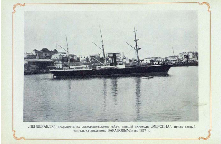
Ek 1: Mersin Vapuru Sivastopol Limanı'nda