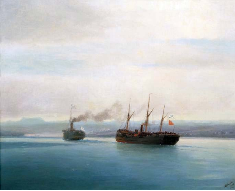
Ek 3: İvan Konstantininoviç Ayvazıvskiy'in Mersin Vapurunu'nun Götürülüşünü Tasvir Eden Çalışması