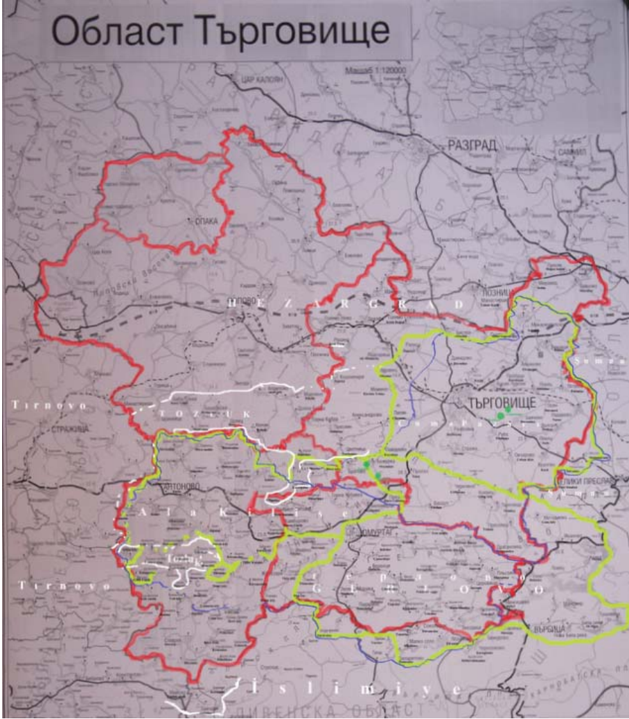
Ek 3: 1641 Yılı Eski Cuma ve Ala Kilise Nahiyeleri