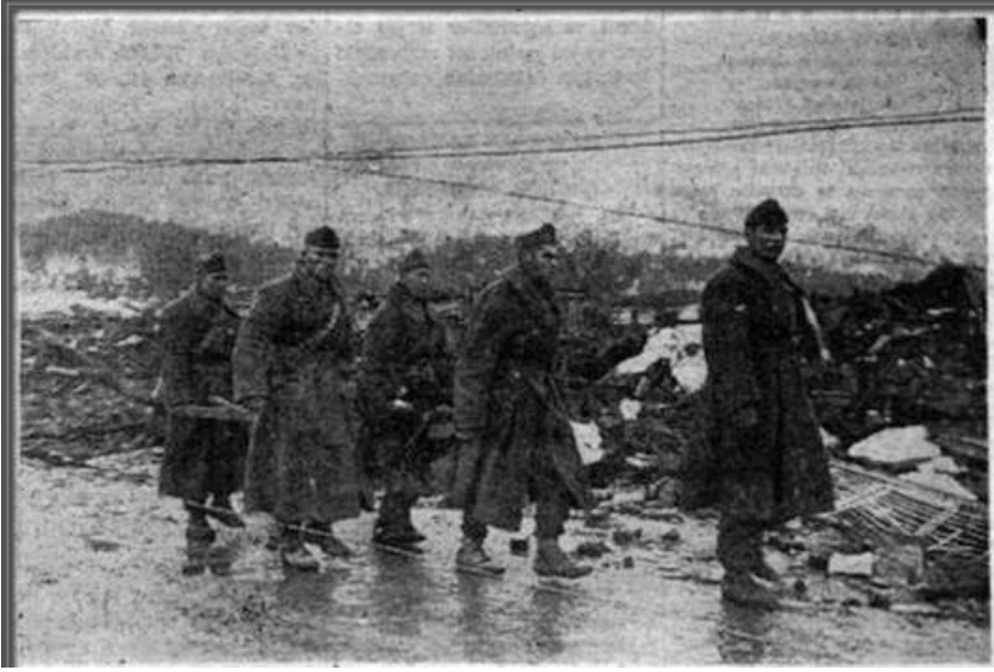
Ek 3: Enkaz çalışmalarını gösteren bir resim. https://tarihtetozlusayfalar.blogspot.com.tr/2017/03/1953-yenice-gonen-depremi.html .