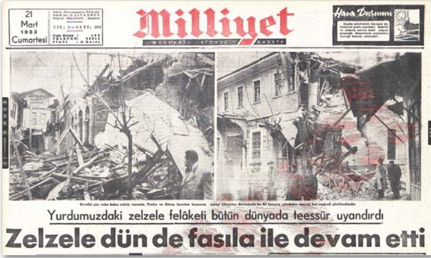
Ek 1: Depremin hemen sonrasında bir kare. Milliyet , 21 Mart 1953, s. 1.