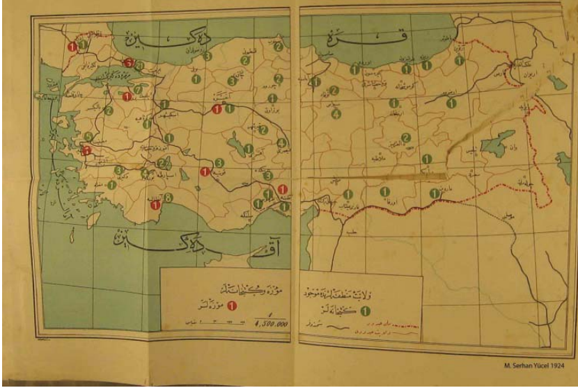
Ek 4: 1925-1926 İhsaiyat Mecmuası'ndan:

İlk mektep öğrencilerine ilişkin ihşaiyat, s. 94-95.