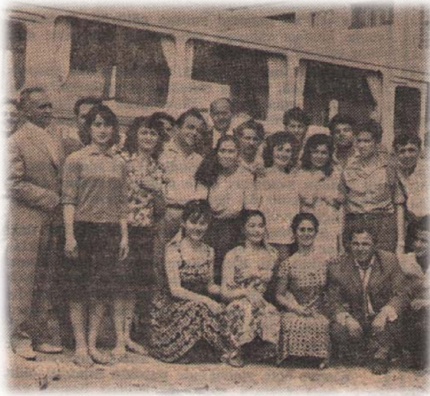
Resim 29: 1965'te Üsküp'te çekilen bir fotoğraf