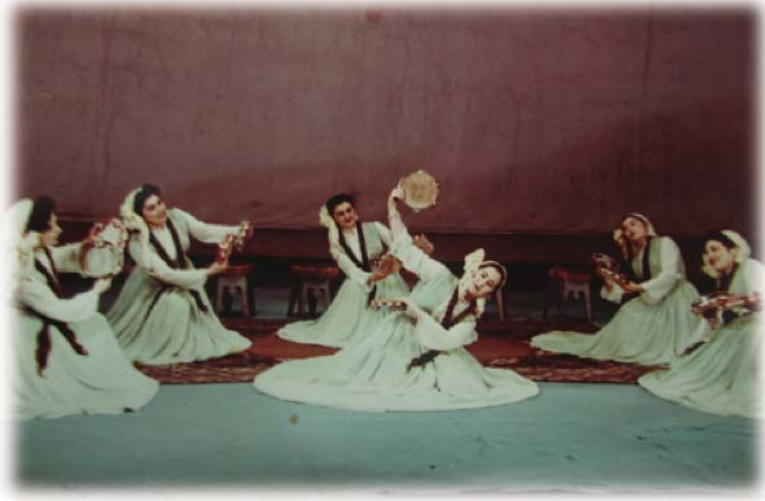
Resim 22: Viyana Televizyonunda gösteri