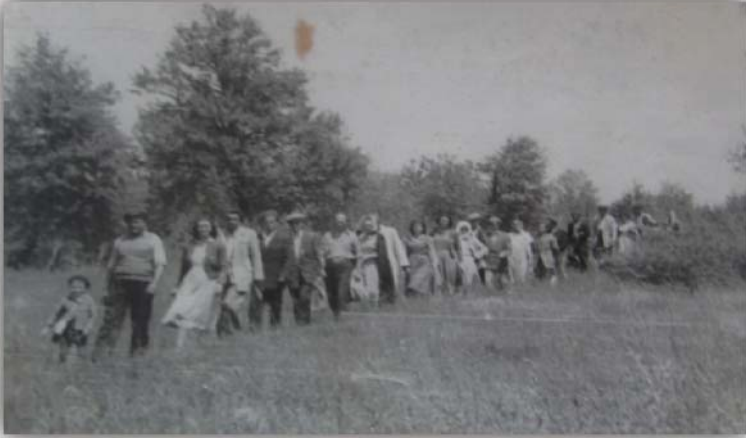
Resim 8: 1955 yılında sanatçılar bir köyden başka bir köye temsile yaya giderken