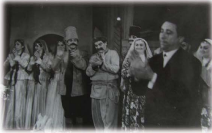
Resim 31: “Mesnet Düşkünleri” komedisi