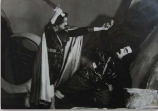
Resim 13: “Ay Masalı” müzikli piyesten bir sahne