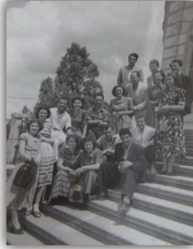
Resim 18: Estrat Tiyatrolarının Birinci Cumhuriyet Gösterisi sonrasında çekilen fotoğraf