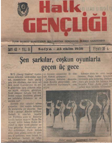
Resim 17: Gazetenin birinci sayfasında yayınlanan “Daire” dansı fotoğrafı