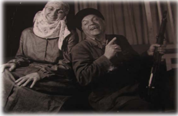
Resim 30: “Horoz Döğüşü” oyunundan bir sahne