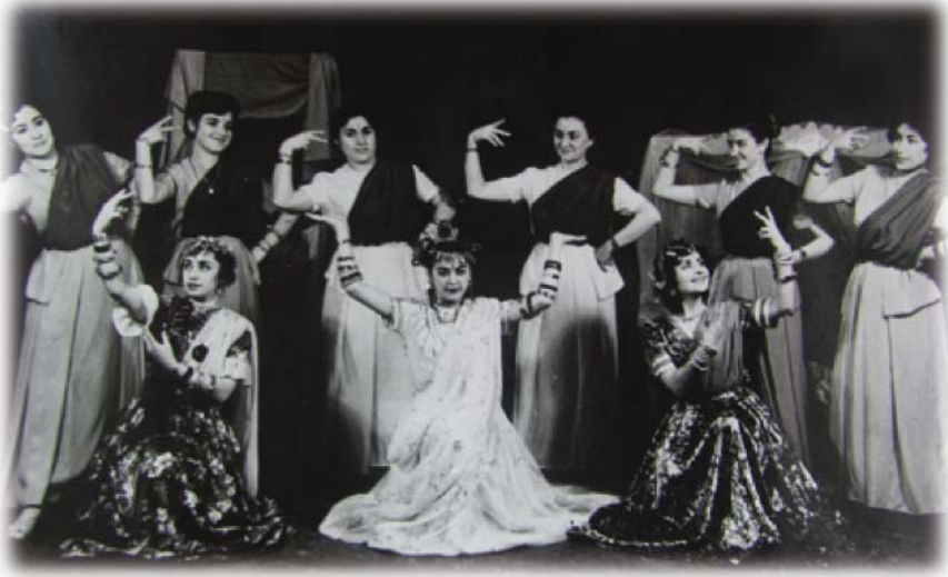
Resim 25: “Hint” oyunundan bir sahne