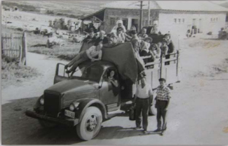
Resim 12: Tiyatro ekibi Deliorman'ın köylerinde turnede