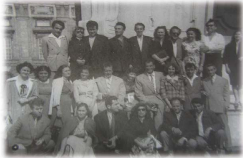
Resim 19: Viyana Televizyonu binası önünde çekilen toplu fotoğraf