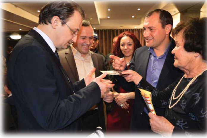
Resim 37: Eski Şumnu ve Razgrad Türk Tiyatro Sanatçıları Buluşması etkinliğinde Şöhret Alaydinova, T.C. Burgaz Başkonsolosu Niyazi Evren Akyol ve milletvekillerine arşivinden fotoğraflar gösterirken