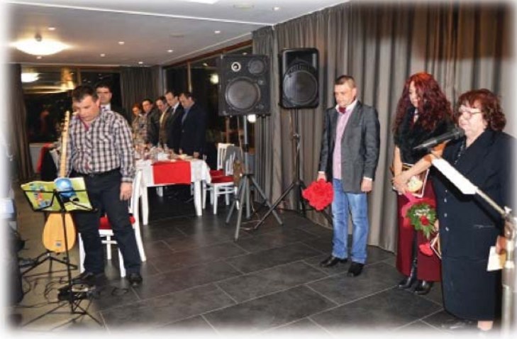
Resim 34: Eski Şumnu ve Razgrad Türk Tiyatro Sanatçıları Buluşması etkinliğinde hayatta olmayan tiyatro sanatçı ve çalışanları için bir dakikalık saygı duruşu