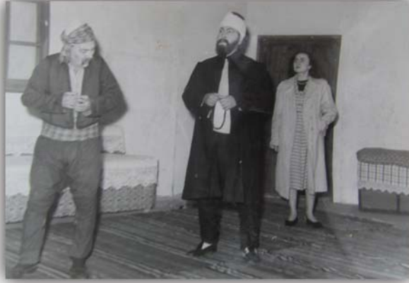
Resim 16: “Allah Verirse” adlı piyesten bir sahne