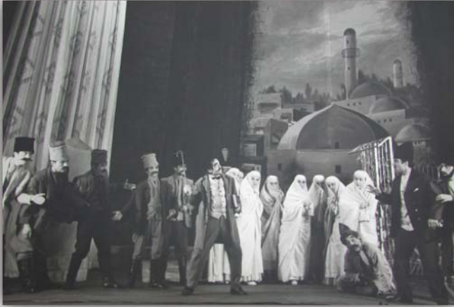
Resim 14: Uzeyir Hacibekov’un “O Olmazsa Bu Olsun” müzikli komedisi