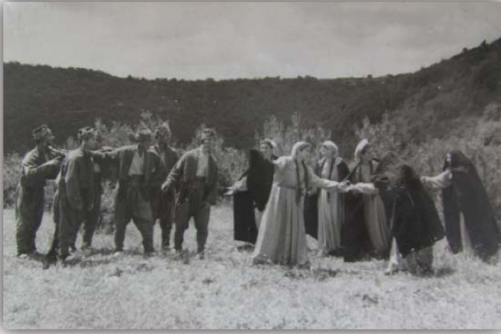
Resim 10: Açık havada temsil