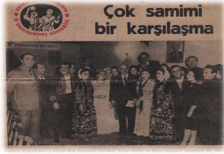
Resim 28: Estrat Tiyatrolarının İkinci Cumhuriyet Gösterisi sonrasında Devlet ve Parti Başkanı Todor Jivkov ile çekilen fotoğraf