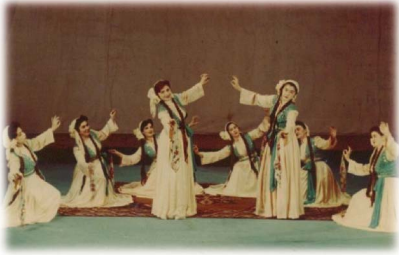
Resim 24: Viyana Televizyonunda gösteri