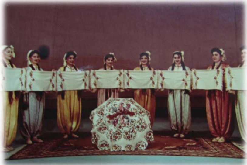
Resim 27: “Mum Alma” oyunu