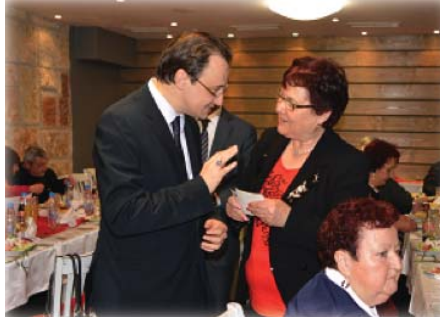
Resim 39, 40 ve 41: Eski Şumnu ve Razgrad Türk Tiyatro Sanatçıları Buluşması etkinliğinden kareler