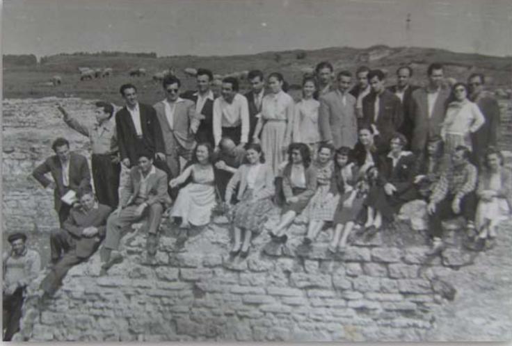
Resim 7: 1953'te çekilen toplu bir fotoğraf