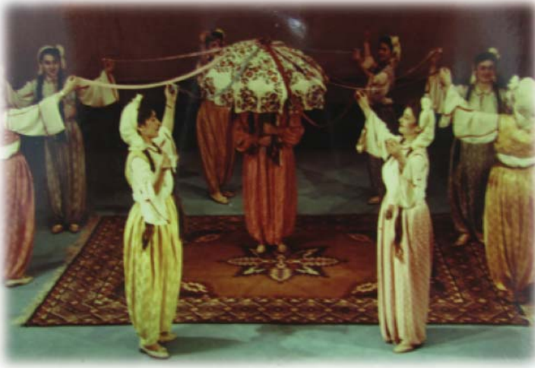
Resim 23: Viyana Televizyonunda “Mum Alma” oyunu