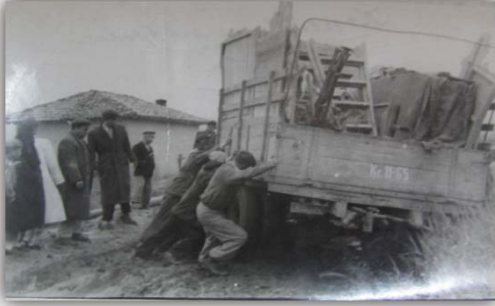
Resim 11: Tiyatronun turne için kullandığı kamyonunun çamura saplandığı an ve sanatçıların üstün gayretleri