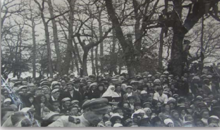
Resim 9: Açık havada temsil