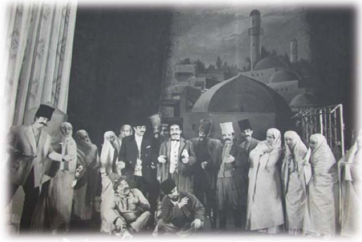
Resim 32: Uzeyir Hacibekov'un "O Olmazsa Bu Olsun" müzikli komedisi