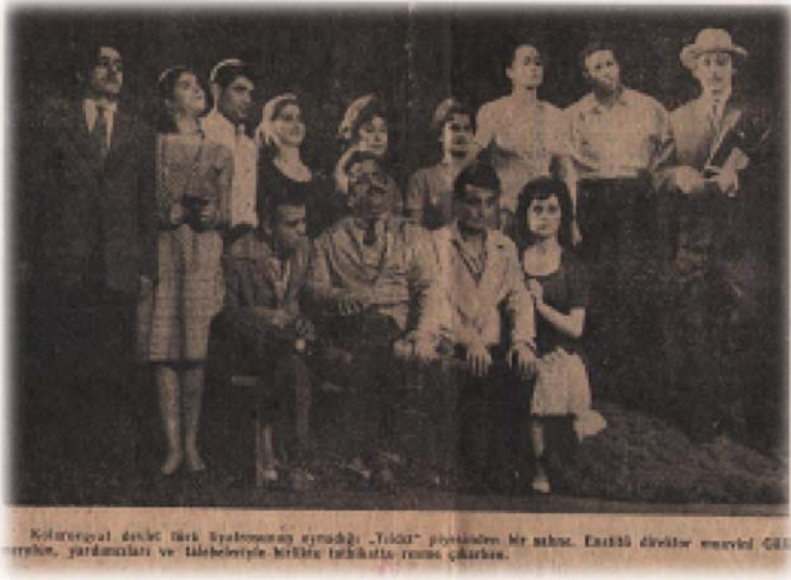
Resim 26: “Yıldız” piyesi provasında çekilen toplu fotoğraf