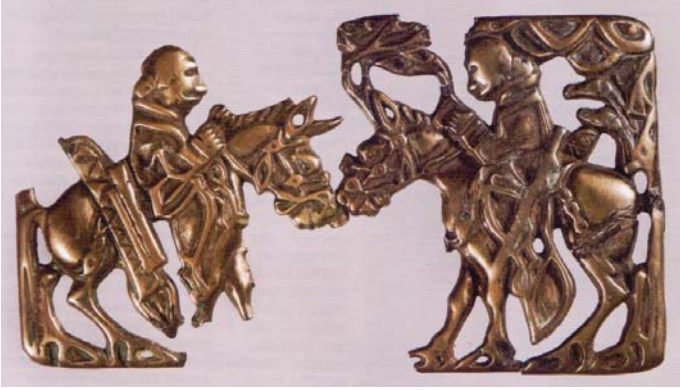
Resim 4: Bozkır kahramanlarının görüşmesi. Hsiung-nu devri.