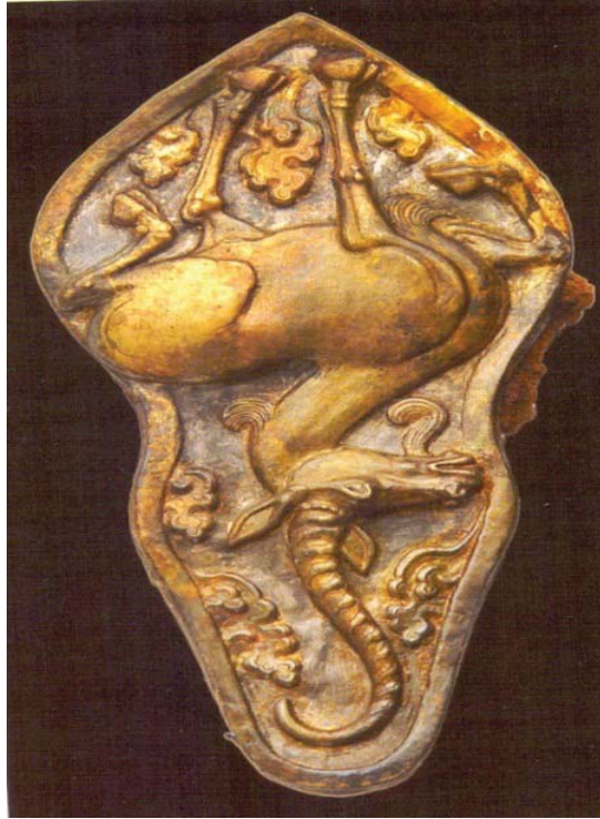
Resim 11: Kutsal sayga. Kuyıskan 4 takı dekorasyonu. M.Ö. II.- M.Ö. I yy. Moğolistan Gol - Mod, Noyan - Ula'daki Sünnü mezarlığından bulunmuştur.