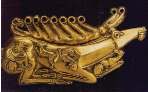
Resim 5: Kutsal geyik. M.Ö. V asır. Kurgan eyaletinden bulunmuştur.