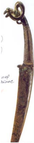
Resim 7: Argali, bakır hançer. uzunluğu 107 cm, Cengiz Han müzesinde muhafaza edilmiştir. MÖ. XI-IX yy.