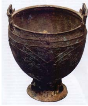
Resim 3: Hsiung-nu kazanı. MÖ. II yy.