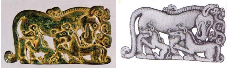
Resim 10: Yilkiya saldırmakta olan iki börü. Altınla kaplı kise 3 nin dekorasyonu. Boyutu 12,6 x 7,1 cm. MÖ IV-III yy. Cengiz Hanın müzesinde muhafaza edilmiştir.