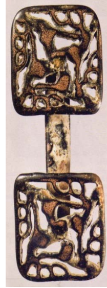
Resim 8: Dört geyiğin kafa görüntüsü. çift düğme, MÖ VII asır. Cengiz Han müzesinde muhafaza edilmiştir.