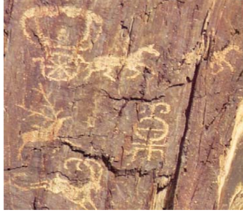
Resim 13: Hsiung-nu'lerin elit sınıfların arabası Kuzey Altay Yaman- us kayasında muhafaza edilmiştir.