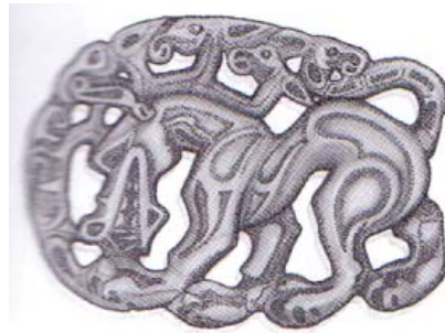
Resim 9: Etrafını kutsal kuşlar sarmış kutsal börü. M.Ö. III-I yy. Cengiz Han müzesinde muhafaza edilmiştir.