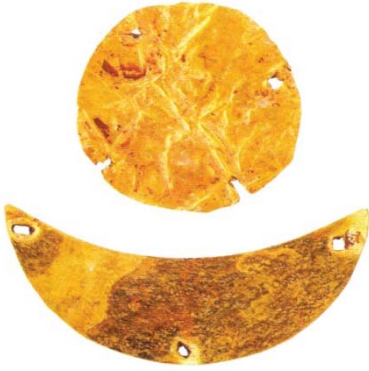
Resim 12: Hsiung-nu'lerin arması